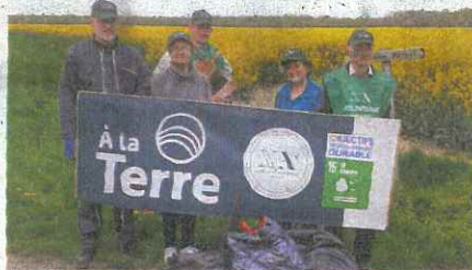
Des déchets ont été récupérés par les bénévoles le long de la route de Verneuil. Nouvelle Acropole

Et un bon jus de pomme accompagné de bruschettas a conclu cette journée avec une grande convivialité. Pour les philosophes de la Nouvelle Acropole, il est important de redevenir amoureux de la terre, de s'émerveiller de ses qualités, et, ainsi, de s'améliorer soi-même pour améliorer le monde.