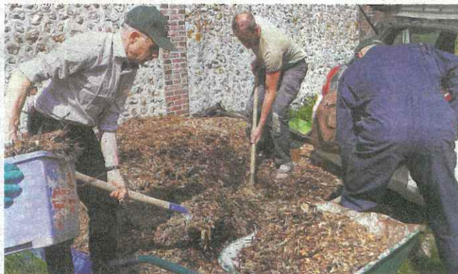
Des travaux ont eu lieu au jardin potager Nouvelle Acropole

L'équipe de volontaires a commencé par une action de ramassage de déchets sur la départementale 941 à Boissy-les-Perche. Munie de sacs poubelles, l'équipe a ramassé près de 25 kg de déchets. Une des participantes a exprimé sa surprise : « J'ai trouvé des